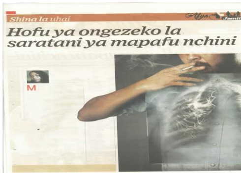
Kielelezo 6: Makala kutoka safu ya 'Shina la Uhai', Taifa Leo, Septemba 21, 2021 uk. 12

pamoja na jina la mwandishi wa makala. Herufi ya kwanza ya neno la kwanza katika aya ya kwanza ni kubwa ikilinganishwa na herufi zingine za neno hilo. Taarifa muhimu kwenye aya za safu zinasisitizwa kwa kutumia hati za kiitaliki, zilizokolezwa wino au zinazotumia wino wa rangi tofauti jinsi ilivyo katika mfano wa kielelezo cha 6.