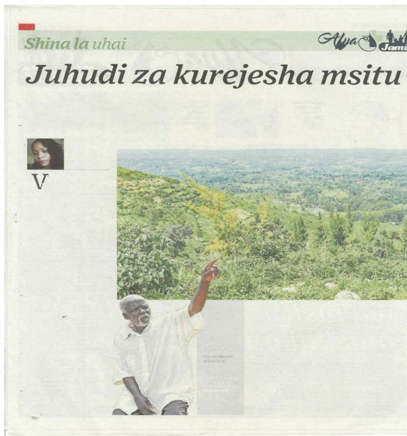
Kilelezo 2: Makala kutoka safu ya 'Shina la Uhai', Taifa Leo, Juni 8, 2021 uk. 12-13

Matokeo ya utafiti yanaonyesha mpangilio wa kurasa za safu kuhusu mazingira kwa utaratibu mahususi katika gazeti la Taifa Leo . Kila ukurasa unaonyesha taarifa za habari za matukio ya aina mbalimbali. Kila ukurasa unaonyesha safu ya habari, mwandishi wa habari zenyewe, tarehe ya kuchapishwa kwa taarifa zenyewe na ukurasa husika.