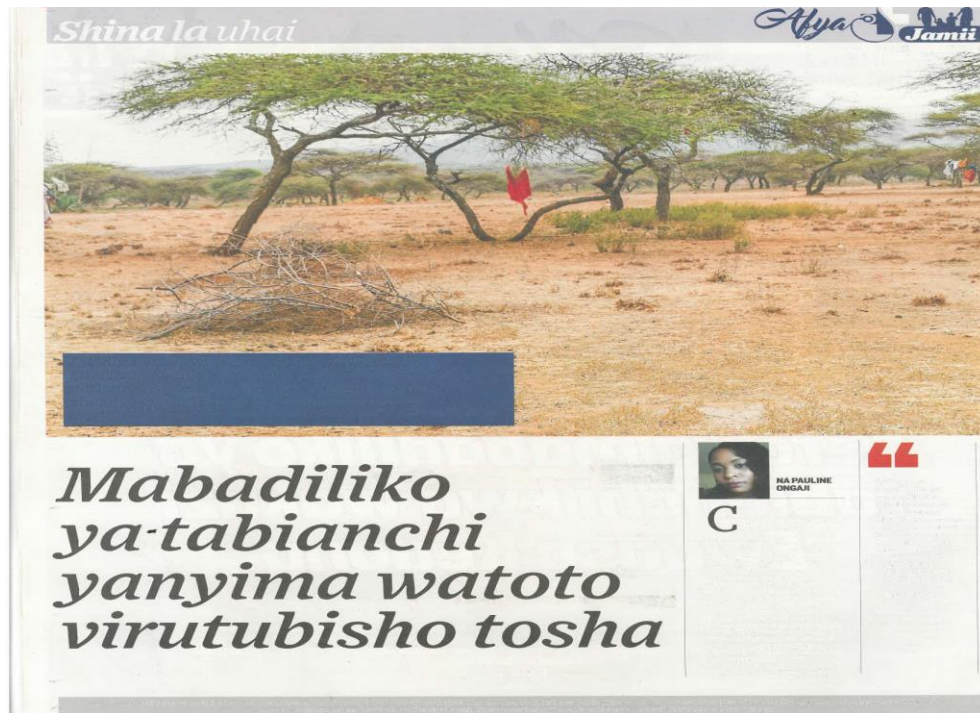
Kielezo 9: Makala kutoka safu ya 'Shina la Uhai', Taifa Leo, Agosti 24, 2021 uk. 12

Katika matini iliyo kwenye kielezo cha 9 kichwa cha habari kina mvuto wa kumshawishi msomaji kuwa mabadiliko ya tabianchi huwanyima watoto virutubisho tosha. Mwanahabari analenga kubadilisha imani na mielekeo potovu katika jamii kuhusu magonjwa ya utapia mlo yanayowaathiri watoto. Kupitia kwa lugha ya kushawishi yenye mvuto na ushahidi wa kisayansi mwanahabari analenga kubadilisha imani na mwelekeo wa jamii kuhusu magonjwa yanayatokana na lishe bora au lishe duni kwa kuhusisha chanzo chake na mabadiliko katika hali ya tabianchi.