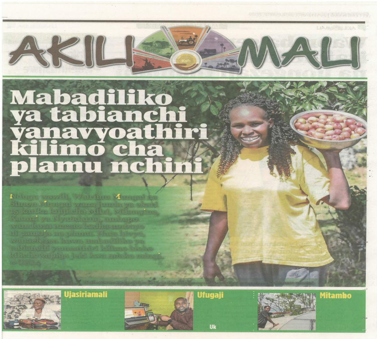
Kielezo 12: Makala kutoka safu ya ‘Akili Mali’, Taifa Leo, Januari 12, 2021 uk. 13

Matini ya kimazingira katika kielezo cha 12 inatumia mada yenye lugha yenye mwelekeo wa kuhamasisha na kufundisha wasomaji kuhusu uwezekano mkubwa wa mabadiliko ya tabianchi kuathiri kilimo cha plamu nchini Kenya. Mwandishi anahamasisha na kufundisha wasomaji kuhusu jinsi mabadiliko katika tabianchi yanavyohujumu shughuli za kilimo cha matunda na mboga nchini na namna ya kukabili mabadiliko hayo.