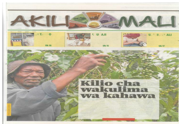
Kielezo 14: Makala kutoka safu ya 'Akili Mali', Taifa Leo , Februari 23, 2022 uk. 13

Matini zinazolenga kuchochea ari ya pamoja hutumia lugha ya kutia hamasa na kuchochea ghadhabu kwa watu kuchukua hatua za pamaoja kuauni hali fulani inayowakabili. Lugha ya aina hii inalenga kuamsha hisia za pamoja ili kufanya uamuzi utakaowanufaisha watu wote wanaokabiliwa na tatizo fulani (Huang, 2007). Mfano wa matini ulio katika kielelezo cha 14 uliokusanywa kutoka gazeti la Taifa Leo unabainisha makala yanayolenga kuchochea ari ya pamoja ya wasomaji: