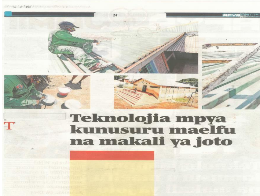
Kielezo 5: Makala kutoka safu ya ‘Shina la Uhai’, Taifa Leo, Novemba 23, 2021 uk. 14-15

Matumizi ya rangi za samawati na nyekundu katika mchoro wa kielelezo cha 5 yanatimiza malengo ya kimawasiliano. Rangi ya bluu iliyotumika katika mada ndogo inaonyesha hali shwari na matumaini katika mazingira ya binadamu kutokana na uvumbuzi wa rangi hiyo ya bluu inayozuia joto. Matumizi ya rangi nyekundu yanaashiria hali hatari inayotokana na ongezeko la joto linalosababishwa na mabadiliko ya anga. Kuziweka hali hizi mbili kwa usambamba kunalenga kuonyesha ukinzani uliopo binadamu anapotunza mazingira na anapoyaharibu kupitia kwa vitendo vyake.