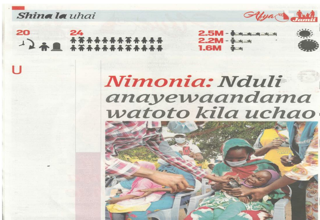
Kielelezo 13: Makala kutoka safu ya 'Shina la Uhai', Taifa Leo, Juni 29, 2021 uk. 12

Matini yenye mwelekeo wa kutamausha hutumia lugha inayokatisha tamaa kwa kuonyesha ukosefu wa matumaini (Huang, 2009). Lengo la kutumia lugha ya aina hii ni kuonyesha mateso, dhiki na mashaka yanayowakabili wahanga wa majanga ya kimazingira. Mfano wa matini iliyo katika kielelezo cha 13 ambayo ilikusanywa kutoka gazeti la Taifa Leo unaonyesha makala inayolenga kutamausha msomaji: