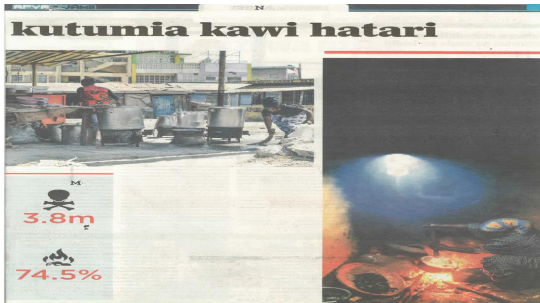
Kielelezo 10: Makala kutoka safu ya 'Shina la Uhai', Taifa Leo, Disemba 7, 2021 uk. 14-15

Matini ya habari inayolenga kukashifu shughuli, tabia au matendo fulani ya binadamu itatumia lugha ya kushutumu, kukashifu na kuonyesha madhara ya vitendo hivyo (Verschueren, 1999). Wanahabari wa matini za kimazingira waliolenga kukashifu shughuli na vitendo vya binadamu vilivyoathiri mazingira walitumia lugha ya kukemea na kukashifu vitendo hivyo. Mfano wa kielelezo cha 10 unaonyesha matini ya kimazingira inayoshutumu shughuli za binadamu zinazoathiri mazingira zilizokusanywa kutoka kwa gaezeti la Taifa Leo :