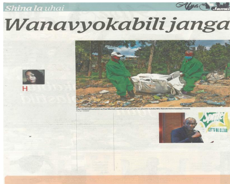
Kilelezo 3: Makala kutoka safu ya 'Shina la Uhai', Taifa Leo , Julai 6, 2021 uk. 12-13

Matini zilizochapishwa huzingatia utaratibu maalum wa kuacha nafasi baina ya maneno na vilevile kutoka sentensi moja hadi nyingine au safu moja na nyingine. Sifa hii inazifanya zionekane nadhifu na zenye mvuto kwa msomaji (Hojjati & Muniandy, 2014). Kwa upande mwingine, matini zinazohusu habari za mazingira katika gazeti la Taifa Leo zinaacha nafasi baina ya sentensi kwa utaratibu wa kawaida unaozingatiwa katika matini zilizopigwa chapa katika vitabu. Mwonekano huu unazifanya matini hizi zionyeshe unadhifu unaorahisisha usomaji wake.