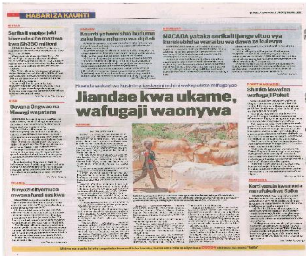
Kielelezo 11: Makala kutoka safu ya 'Habari za Kaunti', Taifa Leo , Septemba 4, 2021 uk. 4

Matini zinazolenga kutahadharisha hadhira hutumia lugha ya kuonya na kuhimiza jamii kuwa makini kutokana na uwezekano wa kuzuka kwa majanga au hali hatari. Lugha hiyo hukusudia kuwafanya wanajamii kuchukua tahadhari ili kujiepusha na majanga hayo (Grundy, 2008). Mfano wa matini katika kielelezo cha 11 uliokusanywa kutoka kwa gazeti la Taifa Leo unaonyesha makala inayolenga kutahadharisha hadhira: